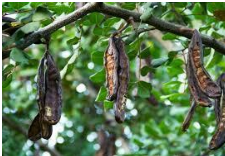
(放蕩息子が飢えをしのごうとした いなご豆)

「入門講座」を学んでいた時、指導司祭が「かいしん」について強調されたのは、各自の思い・言葉・行いが神の意志にかなっているか否かを糾明すること。自己の悪しき汚点を長々と悔やむことではない。立ち直る、神様に帰る方法を具体的に見出すように。残念がるだけでは何も産まれない、ということでした。